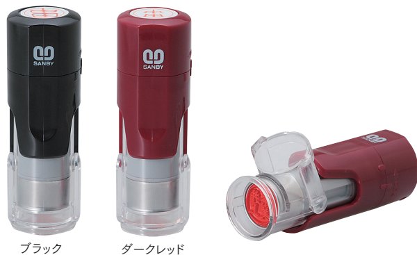
ブラック ダークレッド