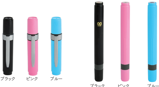
ブラック ピンク ブルー