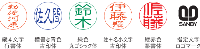
縦4文字 行書体 横書き青色 古印体 緑色 丸ゴシック体 姓+名小文字 古印体 縦赤色 篆書体 指定文字 ロゴマーク 丸枠なし