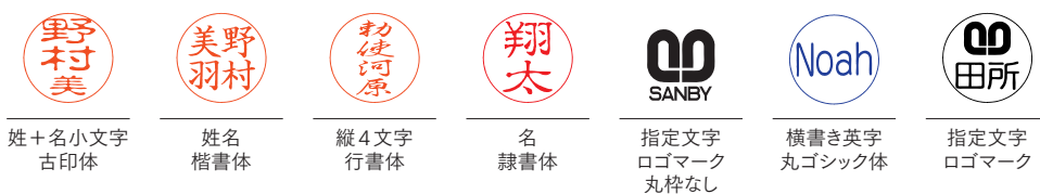
姓+名小文字 古印体

※インクの色をご指定ください。 ※指定のない場合は朱色となります。 ※1度含ませると脱色できません。