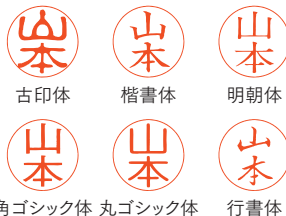
古印体 楷書体 明朝体 角ゴシック体 丸ゴシック体 行書体

※縦書き3文字以内、漢字「姓」のみとなります。 ※メールパックは6書体から選べます。