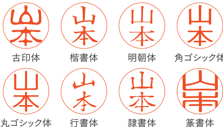
古印体 楷書体 明朝体 角ゴシック体 丸ゴシック体 行書体 隷書体 篆書体