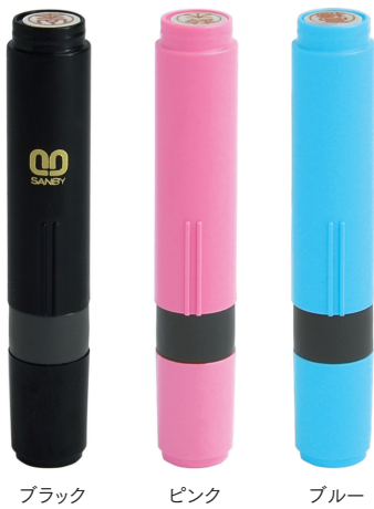
ブラック ピンク ブルー

訂正や記帳に便利。ファッションブルな パステルカラーもそろったスリムな6mmサイズです。