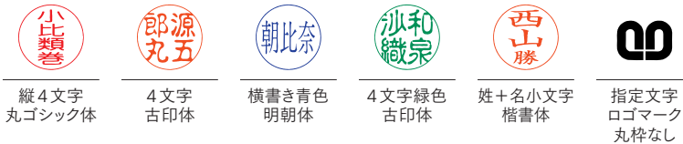
縦4文字丸ゴシック体 4文字古印体 横書き青色明朝体 4文字緑色古印体 姓+小文字楷書体 指定文字ロゴマーク丸枠なし