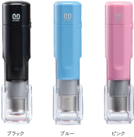
ブラック ブルー ピンク