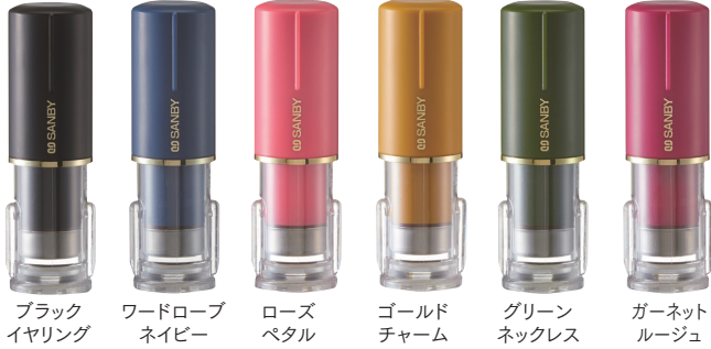
ブラックイヤリング ウードロブネイビー ローズベタル ゴールドチャーム グリーンネックレス ガーネットルージュ