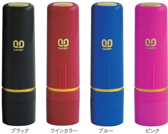
ブラック ワインカラー ブルー ピンク