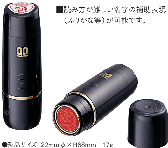
●製品サイズ：22mm φ × H68mm 17g