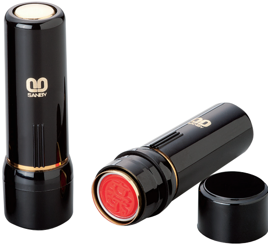
●製品サイズ：21.5mm φ × H68mm 17.5g